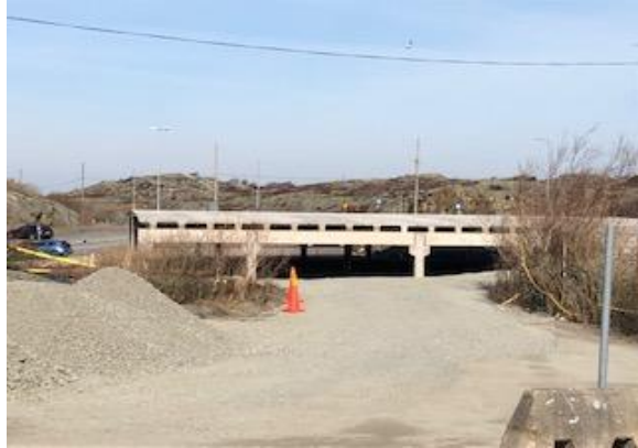
P-hus för boende på Kalvsund o Grötö