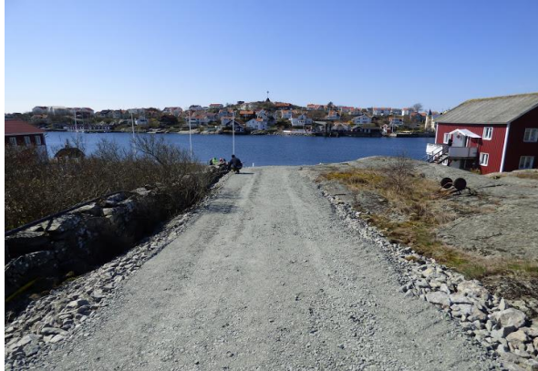
Ny väg som anpassas för funktionshindrade