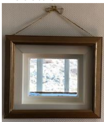
Dekoration i Kiosken